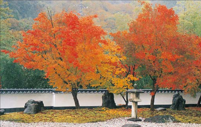
枯山水庭園の紅葉(11月上旬~中旬が見頃)