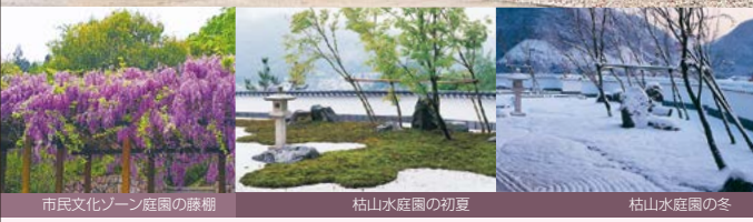
市民文化ゾーン庭園の藤棚