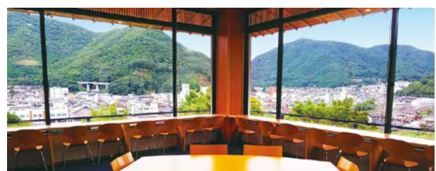
カフェ・休憩室(新見の市街地を展望できます)

喫茶庄 ◆営業時間 9:30~17:00 (ラストオーダー16:30) ◆メニュー ・コーヒー ・アイスコーヒー ・ジュース(オレンジ・りんご) ・抹茶(干菓子付) ・アイスコーヒー ・アイスクリーム ・ちまきセット ・ピザフリットとスープセット ・ケーキセット ※特別展開催中のみ